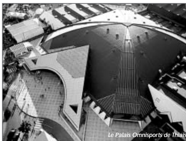
Le Palais Omnisports de Thiais

Pour des coûts de 30% à 50% inférieurs aux outils conventionnels (avion, hélicoptère), les commandes viennent de toutes parts : du particulier pour la vente de son bien, aux entreprises du bâtiment et de la communication. Les élus locaux sont éga-